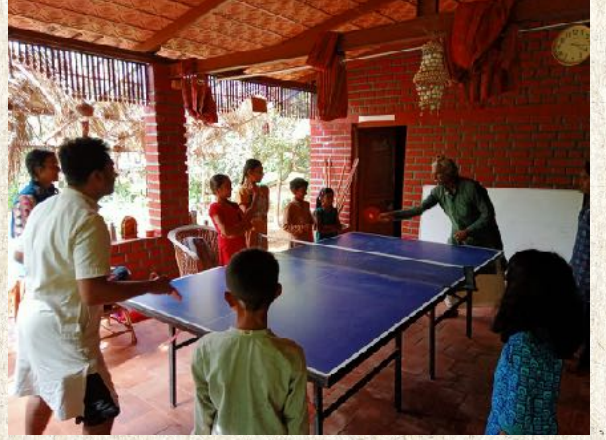
ಶಿಕ್ಷಕರ TT ಆಟ