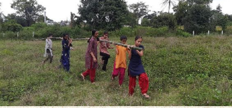
ಅಯ್ಯೋ...ಅಪ್ಪಾ...ಎಷ್ಟು ಬಾರಾ ಇದೆ!