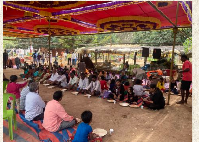
ಬಿಸಿ ಬಿಸಿ ಊಟ