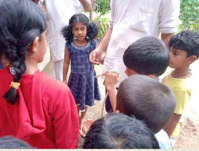
ಇದು ನಿಜವಾದ ಹಾವಾ?