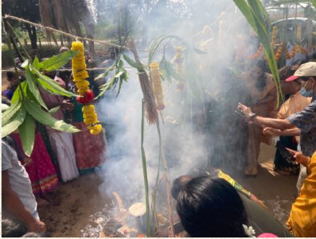
ಪೊಂಗಲ್ ಓ ಪೊಂಗಲ್