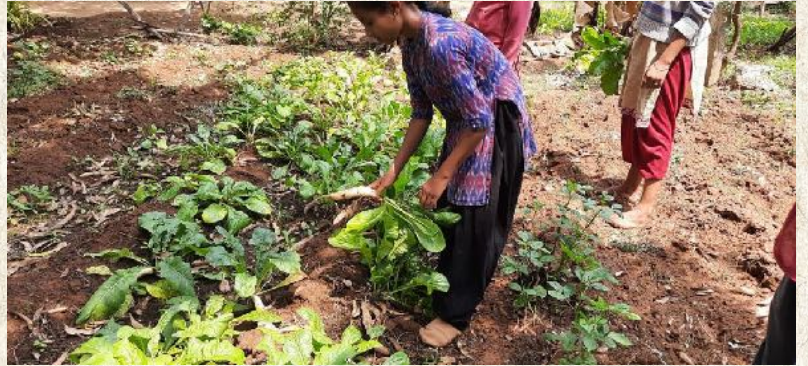
ಇವತ್ತು ಊಟಕ್ಕೆ ಮೂಲಂಗಿ ಸಾರಾ!