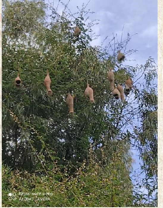
ಗೀಜಗ ಹಕ್ಕಿಗಳ ಗೂಡು