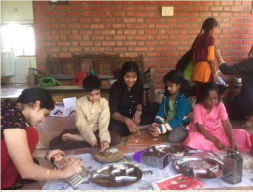
ಬನ್ನಿ ಅಡಿಗೆ ಮಾಡೋಣ...