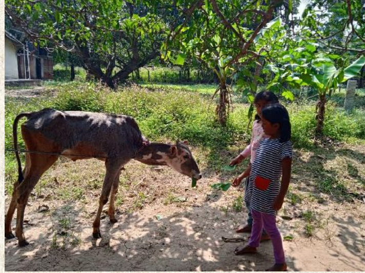
ನಮ್ಮ ಪ್ರೀತಿಯ ಗುರುದೇವ