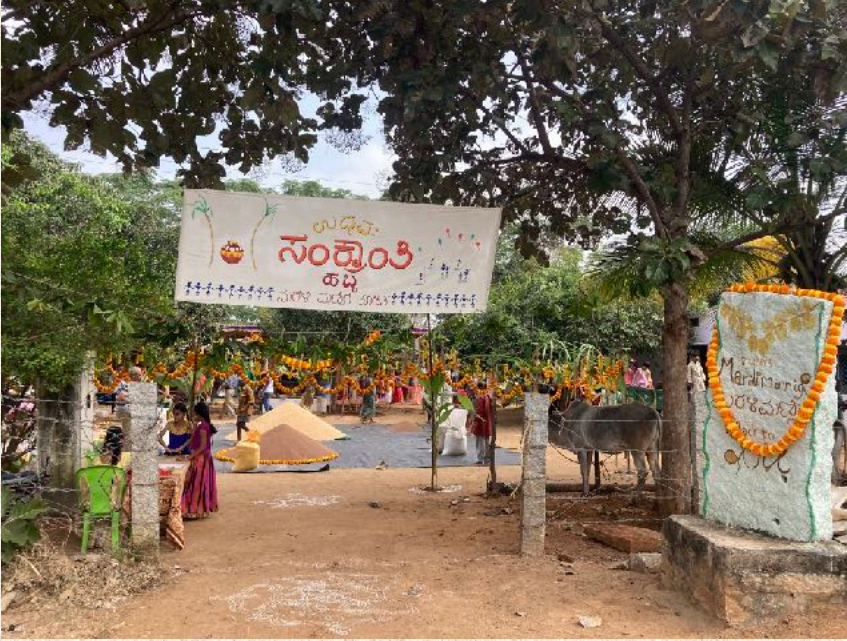
ಮರಳಿಮಣ್ಣಿಗೆ ತೋಟದಲ್ಲಿ ಸಂಕ್ರಾಂತಿ ಹಬ್ಬದ ಆಚರಣೆ

ಉದ್ಭವಃದ ವಾರ್ಷಿಕ ಹಬ್ಬವಾದ ಸಂಕ್ರಾಂತಿ ಹಬ್ಬವನ್ನು ಕೋವಿಡ್ ಲಾಕ್‌ಡೌನ್‌ನ ಹೆಚ್ಚುತ್ತಿದ್ದ ಅನಿಶ್ಚಿತತೆಯ ಮಧ್ಯೆಯೂ ಬಹಳ ಉತ್ಸಾಹದಿಂದ ಆಚರಿಸಲಾಯಿತು. ಗೌರಿಬಿದನೂರಿನಲ್ಲಿ ಸುಗ್ಗಿ ಹಬ್ಬಕ್ಕೆ ರಾಶಿ ಪೂಜೆ, ಗೋಪೂಜೆ ಮಾಡಿ, ಸೂರ್ಯನಿಗೆ ಅರ್ಘ್ಯ ನೀಡಿದೆವು. ಸುಗ್ಗಿಯ ರಾಶಿಯ ಸುತ್ತ 'ಸುಗ್ಗಿ ಕಾಲ ಹಿಗ್ಗಿ ಬಂದಿತು' ಹಾಡಿಗೆ ಮಕ್ಕಳು ಮತ್ತು ಶಿಕ್ಷಕರು ಹೆಜ್ಜೆ ಹಾಕಿದರು. ಅಲ್ಲದೆ ಜನಪದ ಸಂಗೀತ ಕಲಾವಿದರಿಂದಲೂ ಕಾರ್ಯಕ್ರಮ ನಡೆಯಿತು.